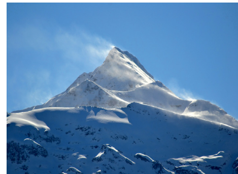
Les Pyrénées

Puis au fil des kilomètres qui défilent, une impression de solitude : plus personne. Crainte d'être égarés ; mais non, un repère incontestable, une réponse certaine et le fait de « recoller » aux dossards