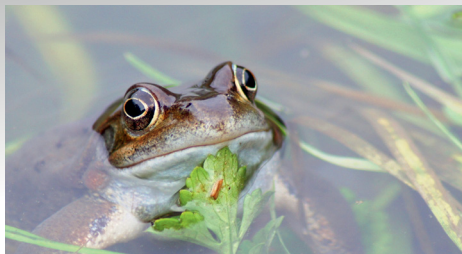
La feuille sous le menton