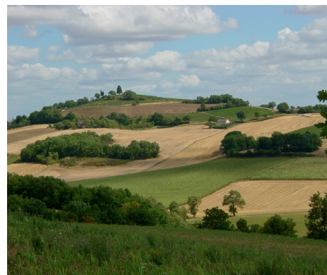
Sentier des coteaux Carlus