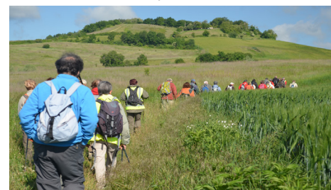
Randonnée "Cinéfeuille" Mai 2014

Tous les programmes sont consultables sur :