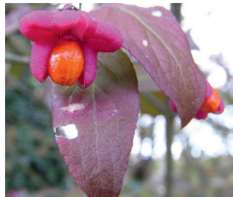
Fusain d'Europe